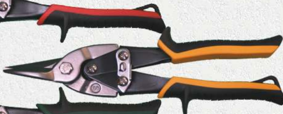
021250S Nůžky přímé pro stříhání plechu