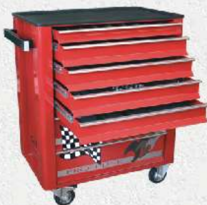
Nářadí je uloženo v přesně tvarovaných podestách