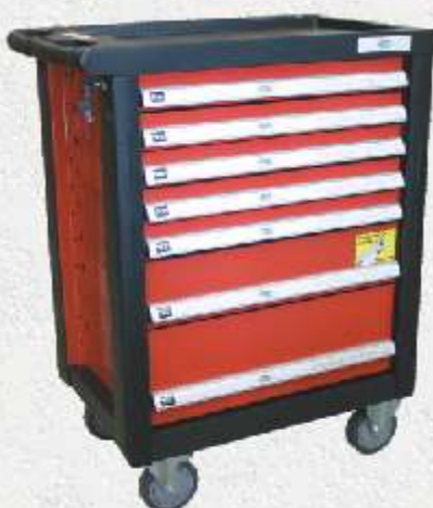
Nářadí je uloženo v přesně tvarovaných podestách